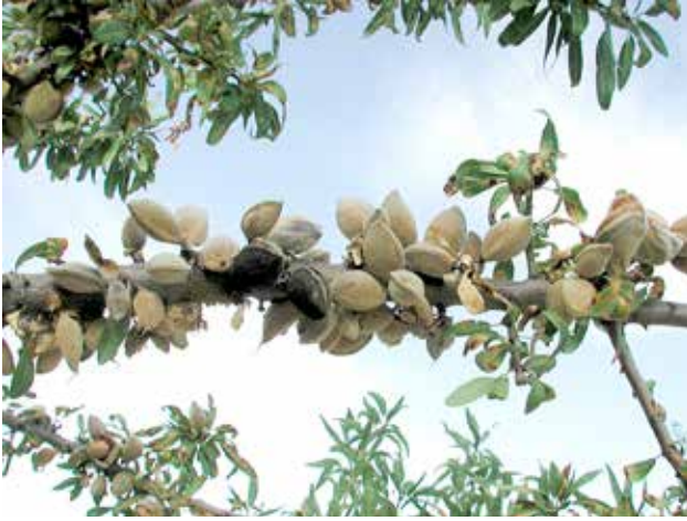
Almendras con daños en recolección