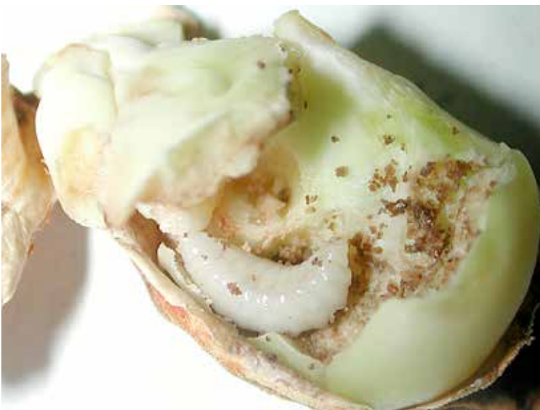
Larva de Eurytoma amygdali en el mes de julio