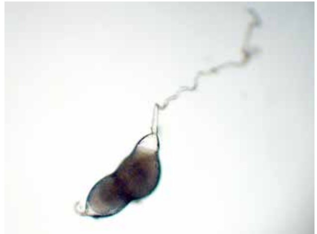
Huevo de Eurytoma amygdali