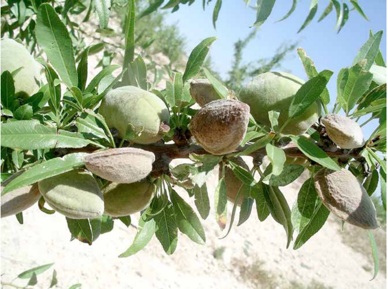
Almendras sanas y con daños en el mes de julio

Las hembras de E. amygdali producen una feromona sexual para atraer a los machos. Se ha identificado su composición química y el producto está disponible comercialmente. La utilización de trampas de feromona para la detección de la emergencia de los machos o como método de captura masiva, podría ser una herramienta de gran utilidad en el control de esta plaga. Sin embargo, en los ensayos llevados a cabo por el CSCV, se han probado feromonas de distintas empresas proveedoras, con varios tipos de trampas y en ningún caso han resultado eficaces para la atracción de los machos.