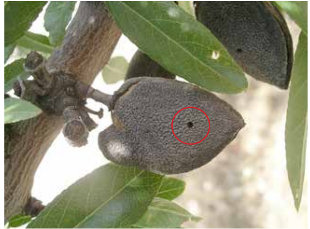
Almendra con orificio de salida de adulto