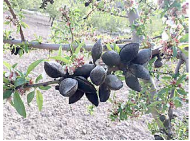
Daños a principios de la primavera