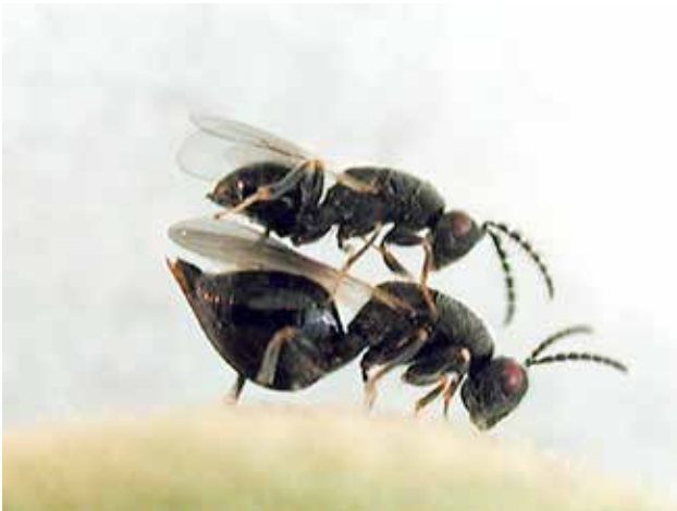
Macho y hembra de Eurytoma amygdali