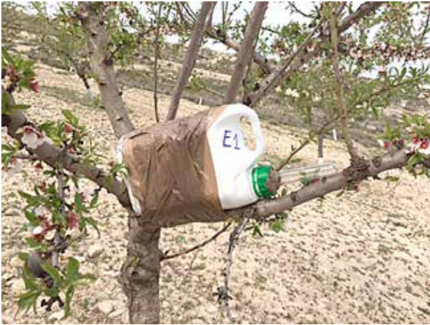
Trampa de emergencia