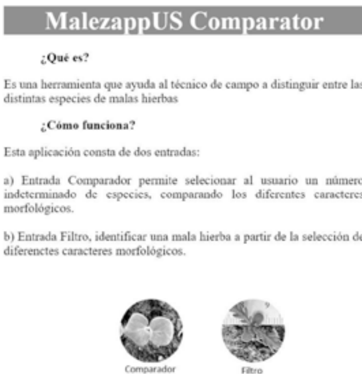
Figura 2. Pantalla de entrada de la aplicación.

A continuación, se muestra una serie de figuras con los distintos pantallazos si se elige la opción COMPARAR (Fig. 2 a 4).