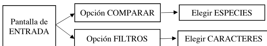
Figura 1. Diseño de funcionamiento de la aplicación.

2.1. Diseño de la app. Una vez se entra en la aplicación, ésta ofrece al usuario la posibilidad de elegir entre la opción COMPARAR o FILTROS. Si se elige la opción COMPARAR, aparece otra pantalla con el listado de especies donde el usuario selecciona las que desea comparar. Si se elige la opción FILTROS, la aplicación debe de mostrar los distintos tipos de caracteres morfológicos para realizar el filtrado de especies arvenses (Fig. 1).